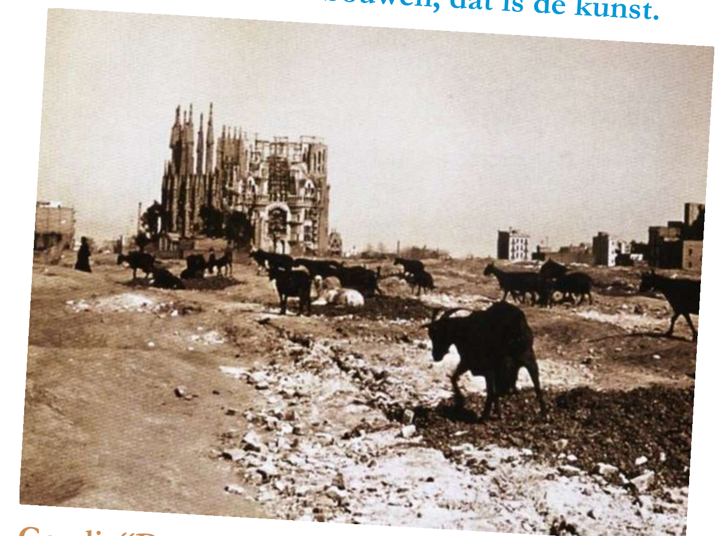
Gaudi: “Don’t worry, my client isn’t in a hurry.”

Hoe krijgt u uw organisatie structureel aan het leren en innoveren? De vraag maakt al duidelijk dat er meer nodig is dan de obligate cursuscatalogus. Bij Huisacademies spreken we liever van het duurzaam organiseren van leren en ontwikkelen. Bouw daartoe, als ware het een kathedraal, uw eigen huisacademie, de krachtbron in uw organisatie die er gaandeweg voor zorgt dat leren ‘gewoon’ wordt, en dat iedereen leert. Beginnen met bouwen, dat is de kunst.